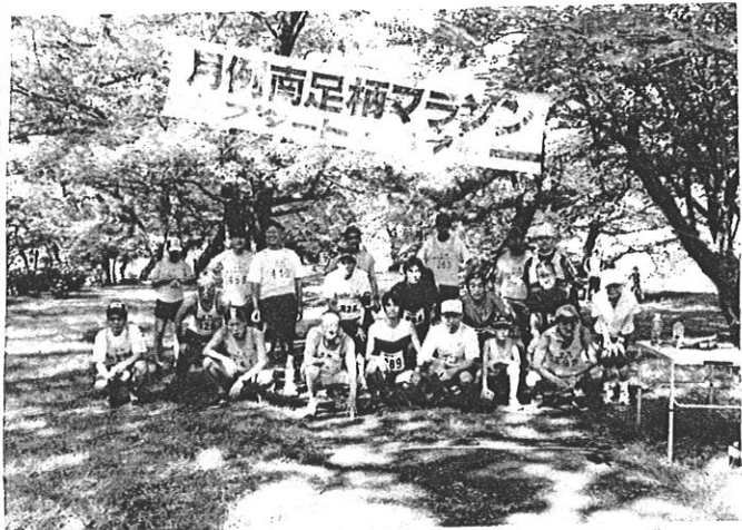
月例南足柄マラソン375回参加者の皆さんです